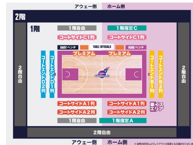
田村市総合体育館