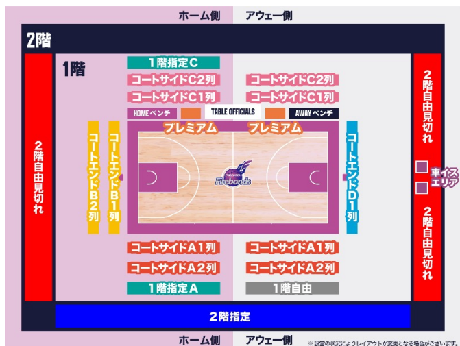
円谷幸吉メモリアルアリーナ